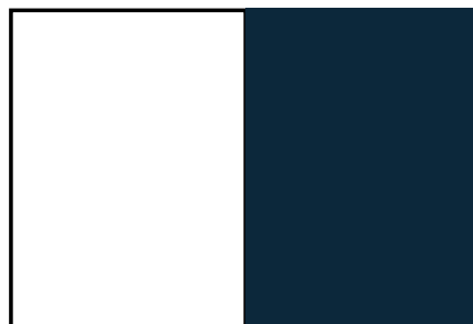
Página simples (209mm x 275mm)