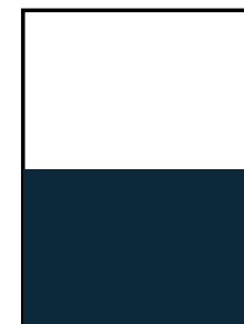
1/2 Página (209mm x 137,5mm)